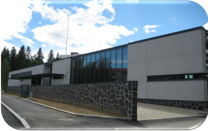
Koukun Helmen keittiö Näsijärven rannassa Koukkuniemessä.